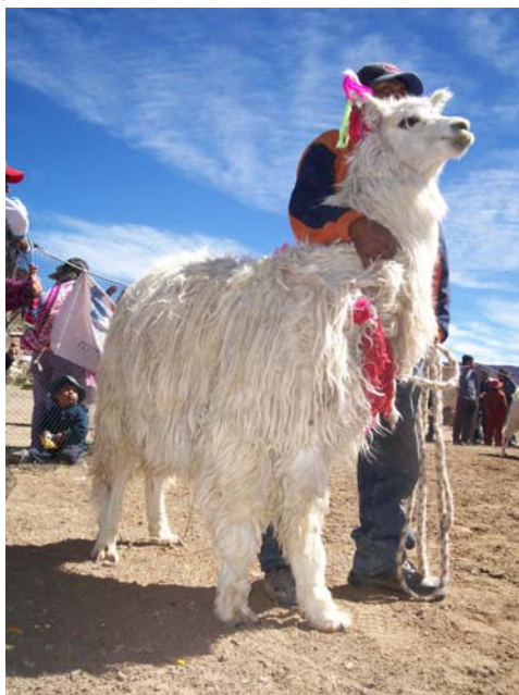
Feria binacional Bolivia-Argentina de la llama

Los camélidos domésticos nos permiten enseñar acerca del proceso de domesticación del guanaco dando origen a las llamas, proceso que se inició hace 5000 años en los Andes y que nos acerca a una de las transformaciones más importantes de los pueblos prehistóricos, pasar de ser cazadores a ser pastores. Las llamas también nos enseñan como es la producción pecuaria de una especie doméstica.