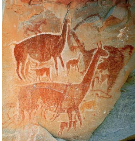
Dibujos rupestres de camélidos

Los camélidos nos permiten recorrer junto con ellos la historia ambiental del altiplano, desde antes de la llegada de la gente a América (los silvestres), cuando la gente recién llegada era cazadora y recolectora y las vicuñas y guanacos eran su alimento y cuando hace 5000 años pudieron a partir de la domesticación fabricar una nueva especie, la llama.