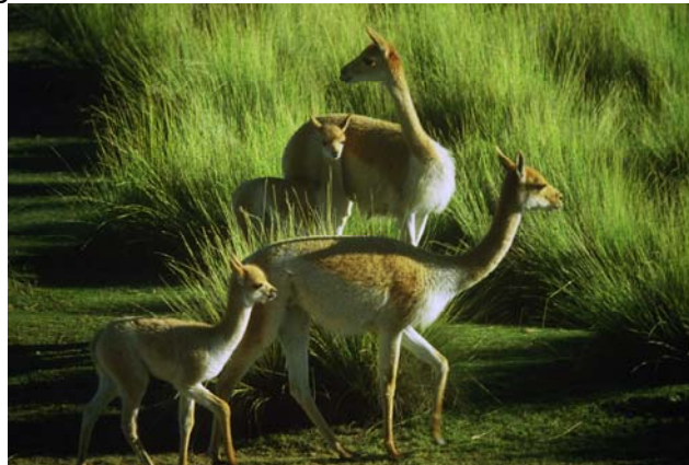
Vicuñas silvestres en Jujuy

Los camélidos silvestres , nos permiten enseñar acerca de los mecanismos de la naturaleza, la adaptación, la evolución , y sobre lo que significa la utilización de la fauna, la caza indiscriminada, el riesgo de extinción, el salvataje, la conservación, el uso sustentable. La fibra de la vicuña es una de las fibras de origen animal mas finas y valiosas lo que ha sido su mayor bendición y castigo.