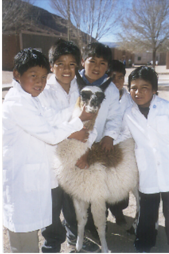
Niños de la escuela de Cienaga de Paicone (Argentina) con su mascota